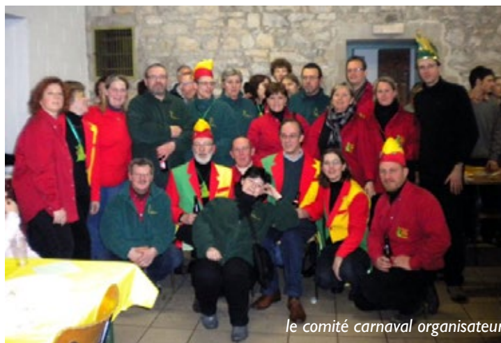
le comité carnaval organisateur